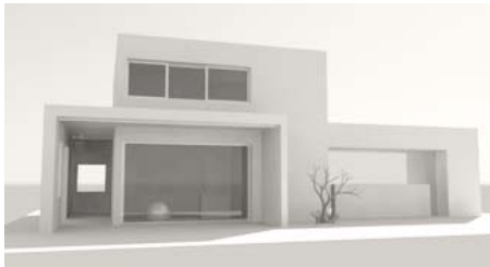
Casa V-Blanco, East Cape Baja California Sur, Mexico. (PROJECT) 3200.00 sq./ft.