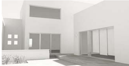
Casa V-Azul, La Paz Baja California Sur, Mexico. 2985.00 sq./ft.