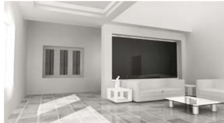
Spa&Ocean, Todos Santos, Baja California Sur Mexico. 3320.00 sq./ft.