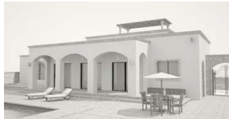
Casa Vista Centenario, La Paz Baja California Sur, Mexico. 1345.00 sq./ft.